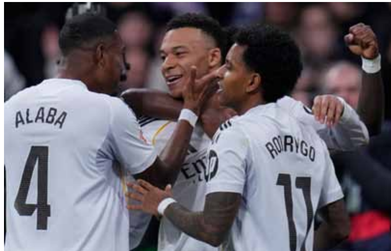
Goleador. El francés viene sosteniendo a un conjunto “Merengue” en crisis.

El francés Kylian Mbappé se hizo cargo del remate desde los doce pasos y, con un disparo cruzado al deslizamiento de Batalla a la izquierda, puso el 2-1 definitivo para el Real Madrid que se mantiene como escolta del Barcelona, con un punto de diferencia.