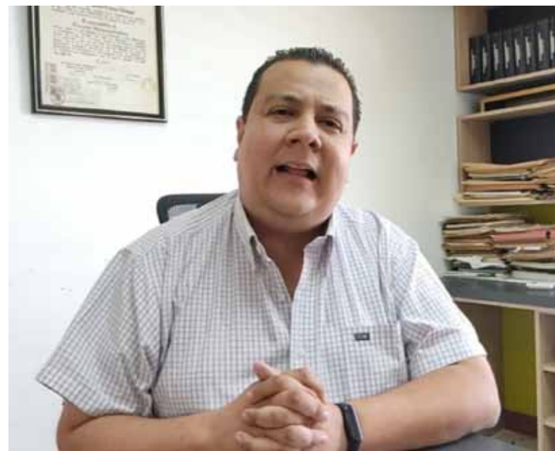
Derechos humanos. La organización de Tarazona se dedicaba a denunciar la presencia de grupos guerrilleros y paramilitares en territorio venezolano.

La ONG Foro Penal confirmó hasta ahora la excarcelación de 310 personas, en el marco de un anuncio de liberación de un "número importante de personas" por parte del Ejecutivo chavista.