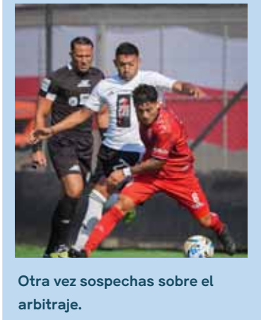
Otra vez sospechas sobre el arbitraje.