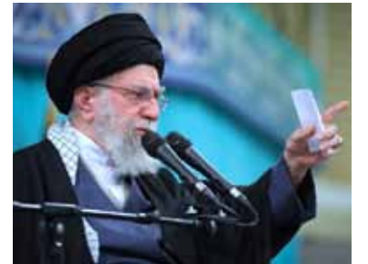
El líder supremo de Irán respondió.

■ El líder supremo de Irán, el ayatolá Alí Jamenei, advirtió ayer que una eventual agresión por parte de Estados Unidos provocará de forma inevitable una "guerra regional", en el marco de un clima de extrema tensión por el despliegue militar de Washington en el Golfo.