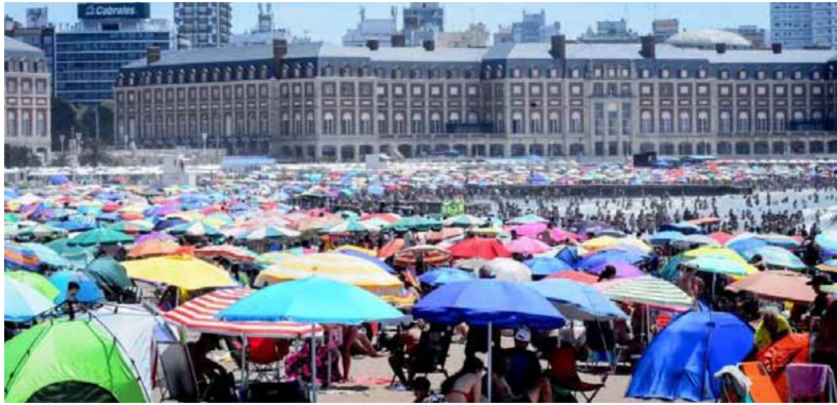
Buen clima. En la segunda quincena mejoró el tiempo y eso hizo que se moviera más gente hacia la Costa.

“La diferencia entre cantidad de tickets y dinero recaudado, en relación con la inflación, fue negativa. Si se habla de una caída general del consumo del 15%, en gastronomía estamos más cerca de los 10 puntos”, explicaron desde AEHG al diario La Capital. El factor clave fue la relación precio-calidad: “Al que mejor le fue es al que logró equilibrar bien lo que cobra con lo que ofrece, sin importar el segmento, muchas veces resignando rentabilidad”. De hecho, algunos restaurantes “tuvieron menús a un precio menor que el verano pasado”.