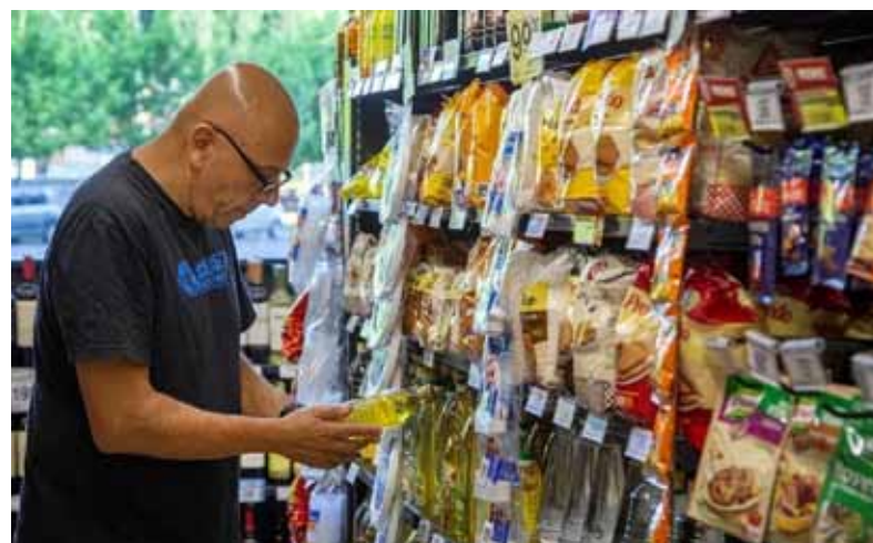
Golpe al bolsillo. Mientras el INDEC se prepara para estrenar una nueva canasta de medición desde febrero, las familias ya sienten el impacto.

De a poco, las familias argentinas comienzan a preparar la canasta escolar para la vuelta a clases. Según un relevamiento privado, tiene un costo de $63.636