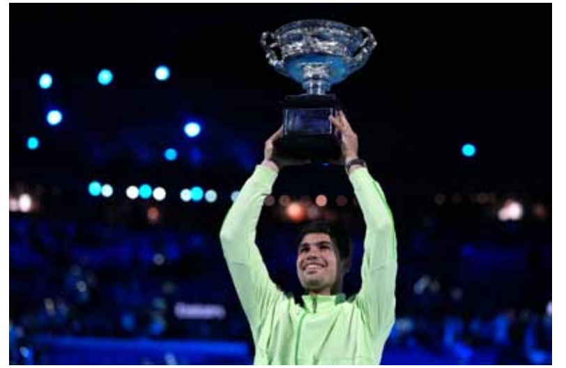
De menos a más: El español firmó el Grand Slam más joven de la historia.

Del otro lado, Djokovic dejó en claro que, pese a la derrota, sigue plenamente vigente. Con casi 39 años, el serbio disputó otra final de Grand Slam y volvió a demostrar que conserva el nivel necesario para seguir compitiendo por los títulos más importantes del circuito, aunque esta vez no pudo alcanzar